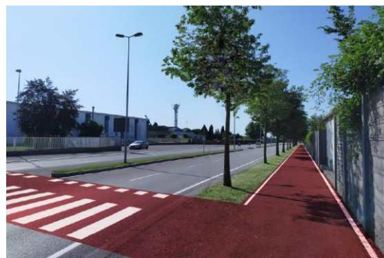
Marciapiede Via dell'Industria (lotto A)