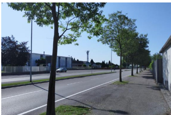
Marciapiede Via dell'Industria