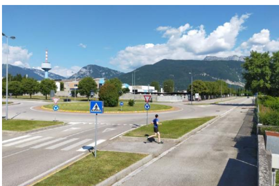
Rotonda via dell'Industria – Via Venezia esistente