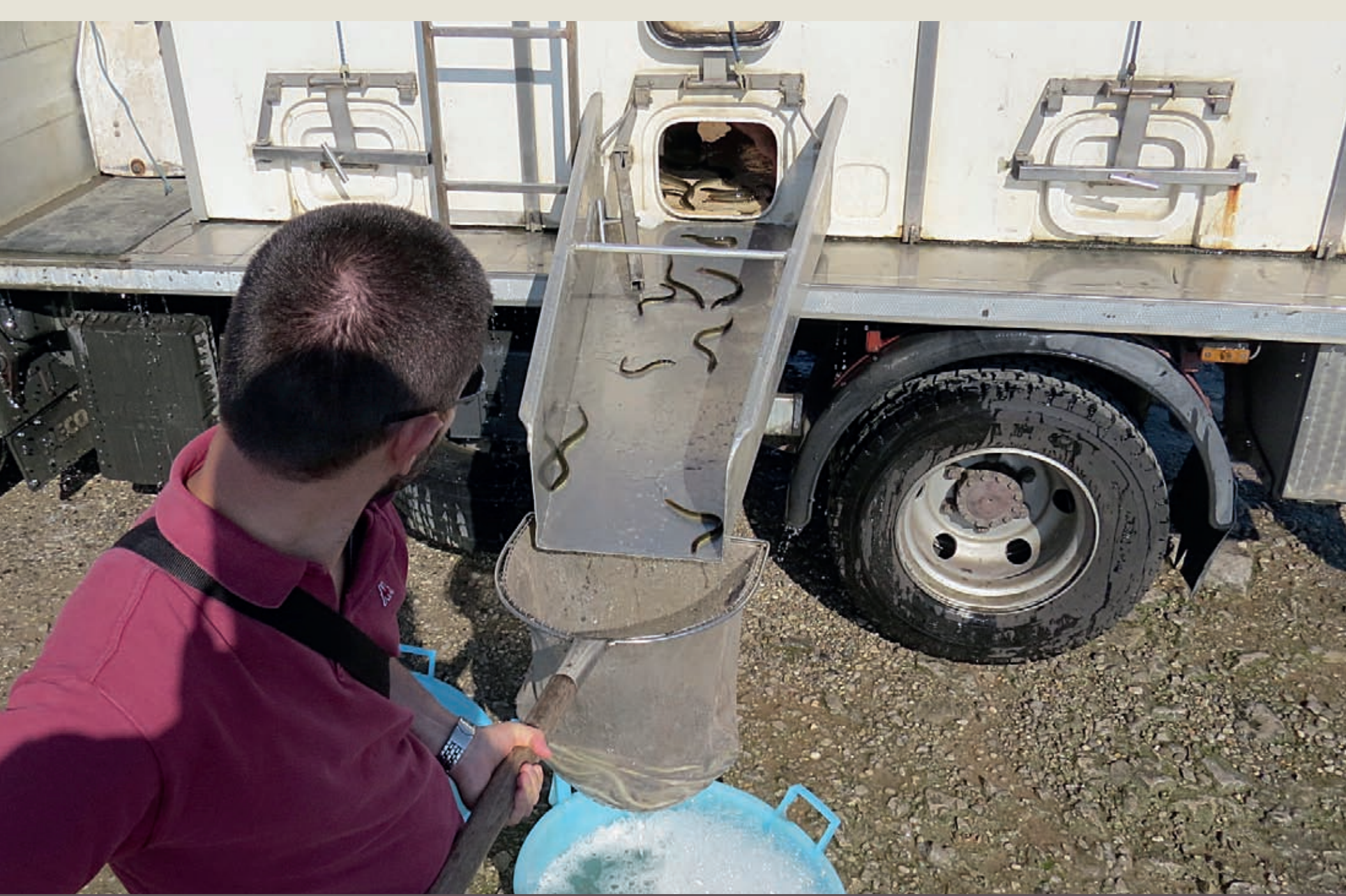
Raccolta delle anguille oggetto di ripopolamento

Per incrementare lo stato delle conoscenze sulla popolazione di Anguilla nelle acque regionali vengono effettuati dei monitoraggi specifici, che prevedono la valutazione degli individui catturati (dimensioni, peso, lunghezza delle pinne, diametro dell'occhio). Dal 2015 parte delle anguille rilasciate nel canale Brancolo vengono marcate con la tecnica degli "elastomeri", sistema bio-compatibile che prevede l'iniezione sottocutanea di una sostanza colorata. Grazie ai monitoraggi, la ricattura degli individui marcati permette di registrarne i movimenti, individuare i diversi ambienti frequentati e quindi approfondire molti aspetti della biologia dell'Anguilla.