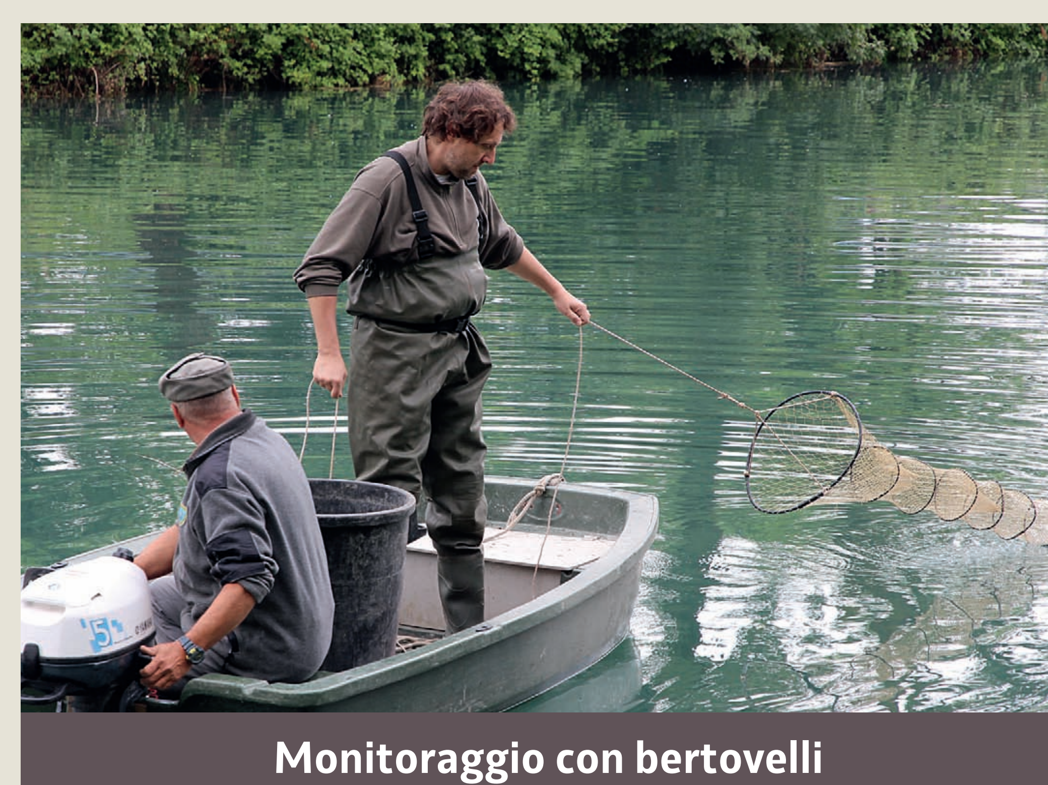
Monitoraggio con bertovelli