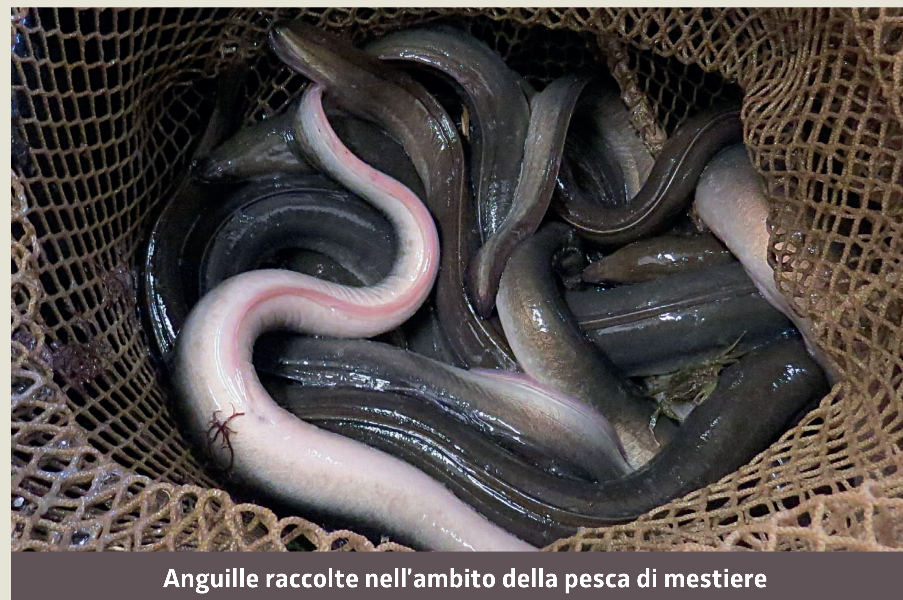
Anguille raccolte nell'ambito della pesca di mestiere

Il Piano regionale di gestione dell'Anguilla prevede una riduzione dello sforzo di pesca, professionale e sportiva, sia nelle acque interne che nelle acque costiere. Inoltre, grazie alla collaborazione dei pescatori lagunari vengono effettuati dei campionamenti stagionali del pescato.