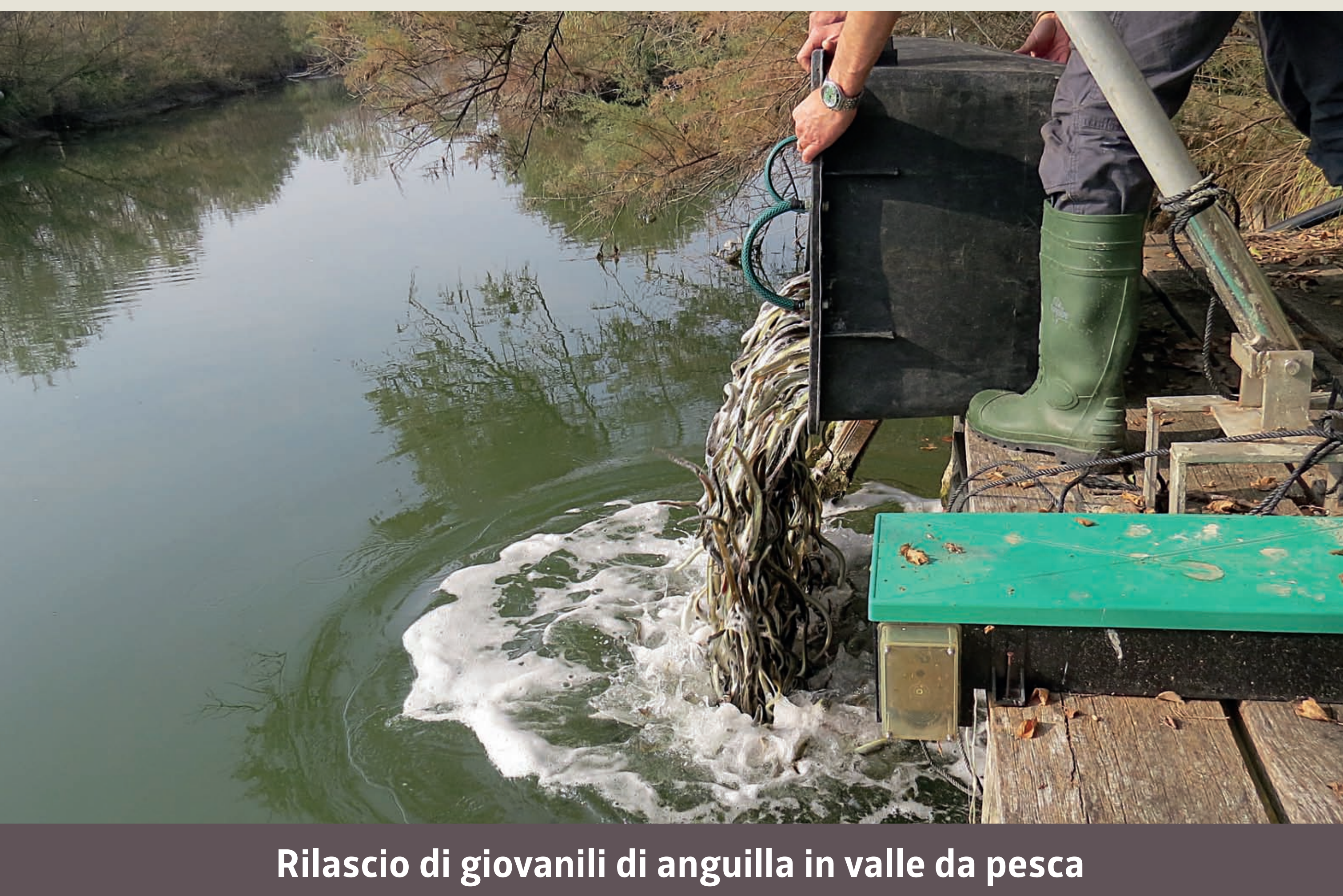
Rilascio di giovanili di anguilla in valle da pesca

Il ripopolamento con novellame di Anguilla viene effettuato in alcune valli da pesca lagunari, dove è possibile controllare i principali parametri ambientali e ricercare le migliori condizioni ecologiche per la vita delle anguille. Dopo qualche anno, le anguille adulte vengono rilasciate per consentire la migrazione riproduttiva verso il Mar dei Sargassi. L'attività di ripopolamento riguarda anche il bacino del canale Brancolo (Provincia di Gorizia), dove è vietata la pesca dell'Anguilla.