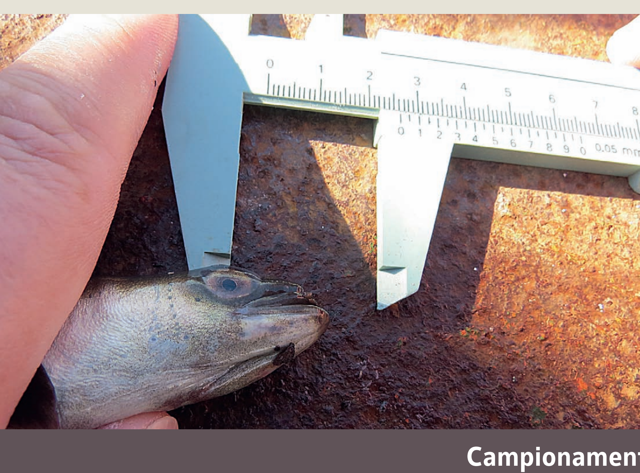
Campionamento delle anguille