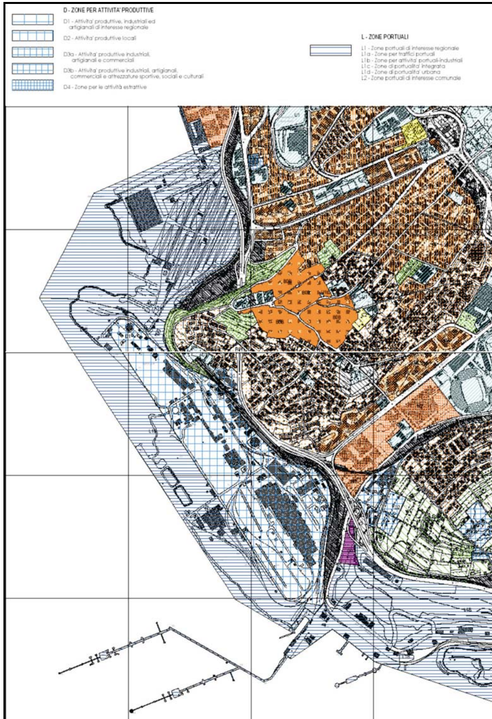
Figura 2 – Stralcio del PRG del Comune di Trieste

In base a quanto previsto dallo strumento Urbanistico vigente (Piano Regolatore Generale riportato in Allegato 2), l'area interessata dal sito è dichiarata in parte Zona D1 - Attività produttive, industriali ed artigianali di interesse regionale . ed in parte Zona L1b - zone per attività portuali - industriali (rif. figura 2).