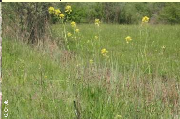
Splendide fioriture di Erucastrum palustre .