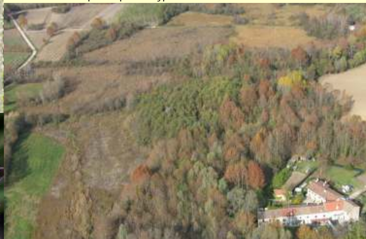
Veduta aerea del biotopo, in basso sulla destra il Molino di Sotto.