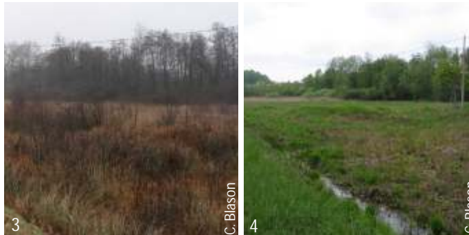
1. Lavori di sfalcio della torbiera 2. Lavori di miglioramento boschivo 3. Torbiera prima del decespugliamento 4. Torbiera dopo il decespugliamento