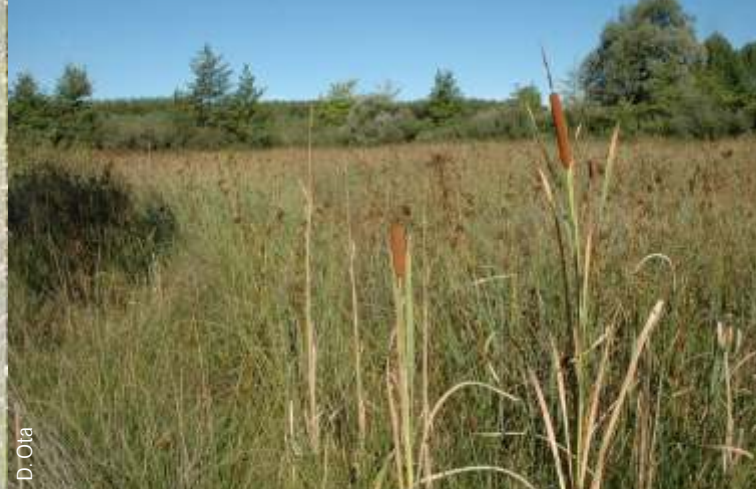
Cladieto con, in primo piano, Typha latifolia .

Biotopo naturale regionale Paludi del Corno