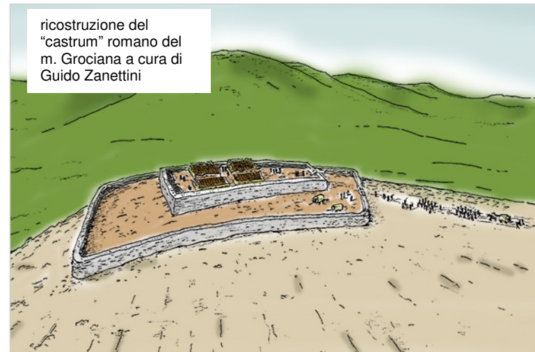
ricostruzione del "castrum" romano del m. Grociana a cura di Guido Zanettini

CASTELLIERE M.ONTE GROCIANA Il Castelliere del monte Grociana è attualmente identificabile solamente per un breve tratto sul versante esposto a sud est, con una massicciata piuttosto diroccata larga circa 4 – 5 metri. Recentemente, mediante una nuova tecnica di rilevamento è stata individuata una struttura costituita da una doppia cerchia muraria di forma rettangolare, di probabile origine confermata dal ritrovamento di alcuni frammenti di orti di anfore risalenti tra la fine del II secolo a.C e l'inizio del I. Si tratterebbe di un "castrum" romano, forse quello descritto da Tito Livio in uno dei capitoli della sua raccolta "Ab Urbe Condita".